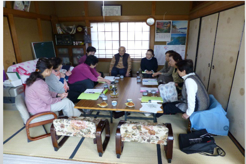
スタッフ会議の様子